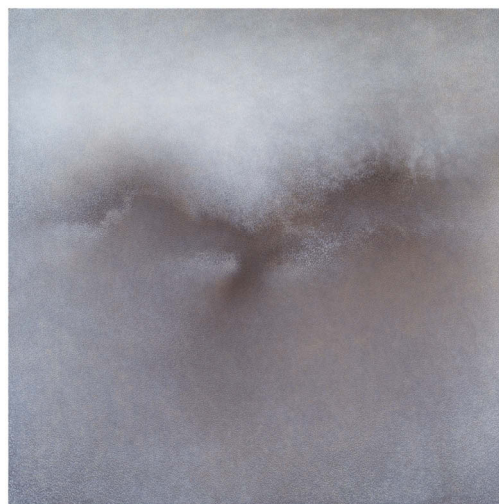
Toru Kaneko Espace, 2018, acrylic on panel, 1760x1760mm

1955年：神奈川県生まれ。 1978年：武蔵野美術大学油絵学科卒業。 1980-82年：フランスの国立美術学校 (École nationale supérieure des Beaux-Arts) に留学。 1982-83年：銅版画の前衛的な研究所 (ATELIER17) にてヘイターに師事。 これまでの主な展覧会に、現代日本美術展、ベルエイムジュン (パリ)、ギャラリエアンドウ (渋谷松濤) をはじめ数多くの個展。 その他の主な活動に、テアトル・ティポグラフィック (フランスで活躍しているエディター) とゲーテのアルマナックの本を製作 (仏、ISSY LES MOULINEAUX市立図書館買上) などがある。