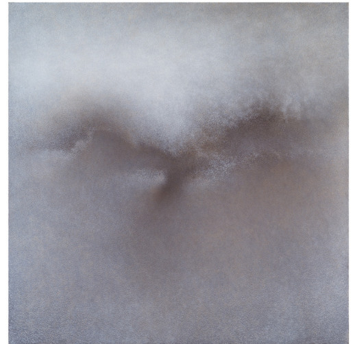
Toru Kaneko Espace, 2018, acrylic on panel, 1760x1760mm

前回、同会場にて「EVOLVINGイメージの解体リアリティへの挑戦 / 2017年2月16日～2月27日」が、金子透と18名の作家による参加で開催されました。期間中、3,000名を超える来場がありました。今回はその第2弾です。