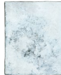
Yuki Nonaka acrylic on canvas, 2017