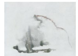
Tomona Konita acrylic on paper, 2017