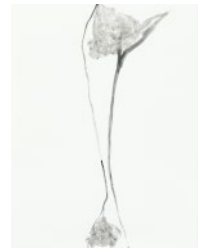
Nobuyoshi Fukushima graphite powder on paper, 2018