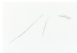
Ai Morikawa charcoal on paper, 2016