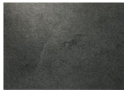
Mikiko Hirayama charcoal on paper, 2018