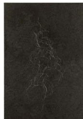
Yutaka Ishida acrylic and pencil on canvas, 2020