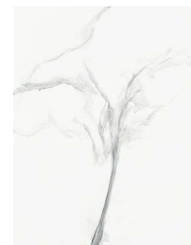
Nobuyoshi Fukushima graphite powder on paper, 2018