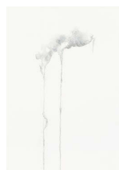
Tomona Konita pigments on paper, 2020