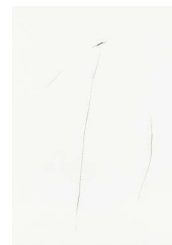
Ai Morikawa charcoal on paper, 2020