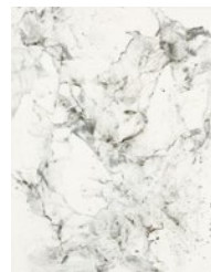
Mai Muragishi mineral pigments on paper, 2021