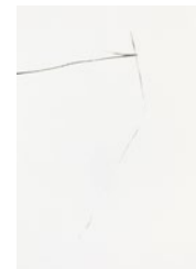
Nobuyoshi Fukushima graphite powder on paper, 2020