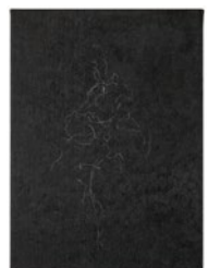
Yutaka Ishida acrylic and pencil on canvas, 2021