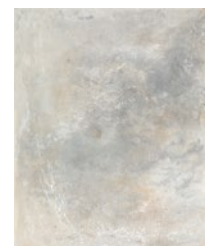
Tomona Konita acrylic on panel, 2021