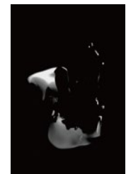
Shun Sato photography, 2021