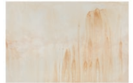
Yuki Sato ink on canvas, 2023