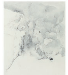
Mai Muragishi mineral pigments and sumi on paper, 2023