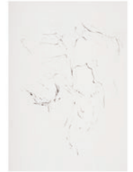
Nobuyoshi Fukushima graphite on paper, 2023