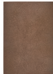
Masanori Hoshino mixed media, 2023