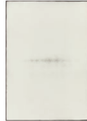
Miki Sugiyama charcoal on paper, 2023